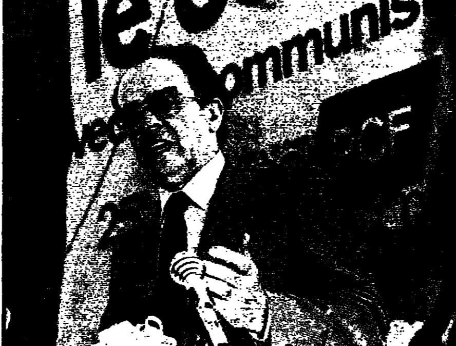
جورج مارشيه في تقرير الساعات الخمس: الخيبة المتعددة الوجوه